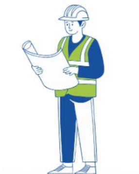
ASSISTANCE À MAÎTRISE D'OUVRAGE