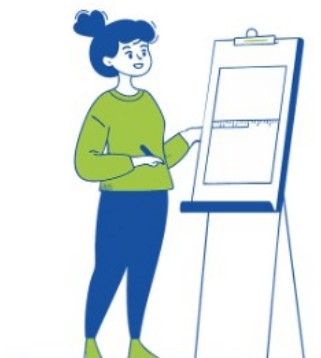
SÉANCES D'INFORMATION POUR LES ÉLUS